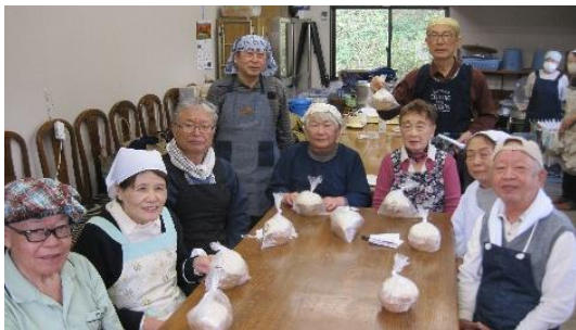
完成後の集合写真