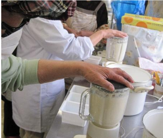
ミキサーで細かく